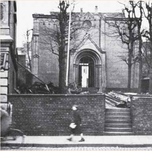
Hattingen, zerstörte Synagoge, März 1939