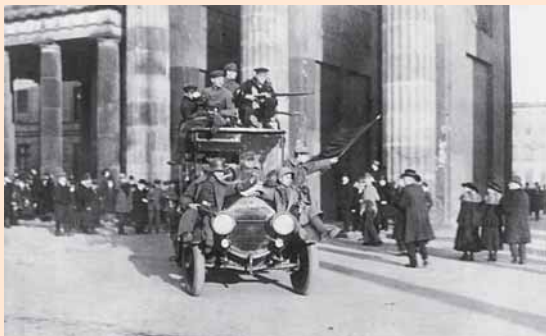
Novemberrevolution 1918 in Berlin, Brandenburger Tor